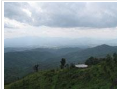
❁ บ้านขุนแจ้