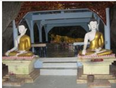
* วัดถ้ำดอกคำ