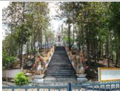
* วัดคุดอนางแล