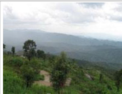
❁ บ้านขุนแจ้