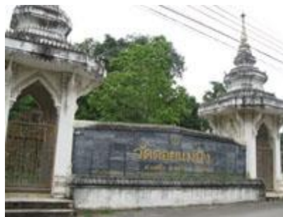
* วัดคอยแม่ปิ้ง