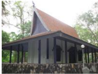
* วัดคอยแม่ปิ้ง