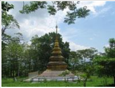
❁ วัดพระเจ้าล้านทอง