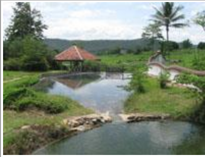
❁ น้ำพุร้อน