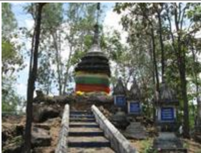
* พระธาตุคุดอนางแล