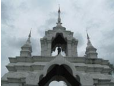
* วัดคอยแม่ปิ้ง