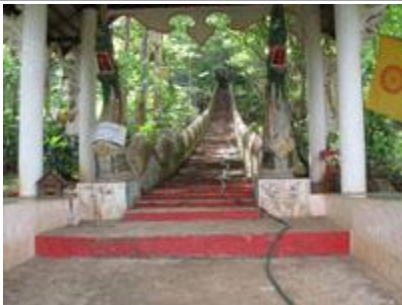
* วัดถ้ำดอกคำ