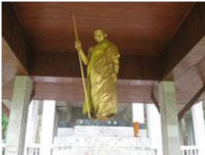
* หลวงปู่แหวนสุจิณโณ วัดคอยแม่ปิ้ง